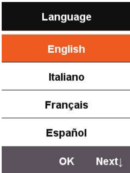
การตั้งค่าพื้นฐาน