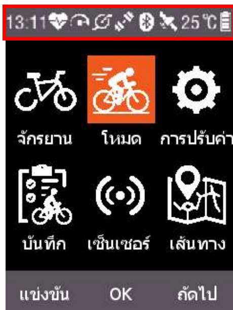
คำอธิบายแถบสถานะ