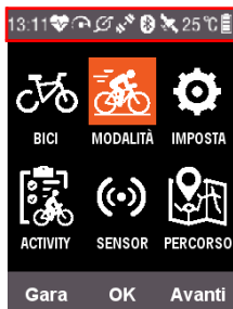
Descrizione barra di stato